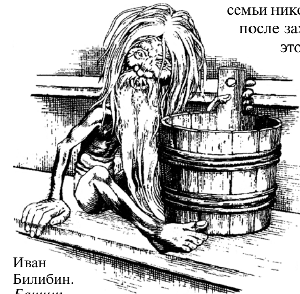
Иван Билибин. Банник

Хозяин бани — Банник — существо злое и опасное; русские семьи никогда не мылись в бане поздно вечером. Считалось, что после захода солнца в бане моется сам Банник и черти. Для этого им оставляли немного воды и кусочек мыла. Если человек пойдёт мыться поздно, черти могут его задушить, а людям покажется, что он запарился до смерти. Ни в коем случае не рекомендовалось ночевать в бане, даже если не было другого ночлега. Но именно потому, что в бане водится нечисть, девушки ходили туда гадать. Гадание происходило так: девушка просовывает в двери бани голый зад. Если Банник погладит её мягкой лапой — это хорошая примета, она выйдет замуж. А если когтистой лапой — быть беде. Одним из самых страшных гаданий было гадание с зеркалом. К двенадцати часам ночи девушка закрывается одна в бане. Раздетая, она садится за стол против зеркала, по бокам которого ставятся две зажжённые свечи. Напротив этого зеркала ставят ещё одно зеркало. Отражаясь одно в другом, зеркала образуют галерею взаимных отражений. И в этой галерее должен показаться будущий жених.