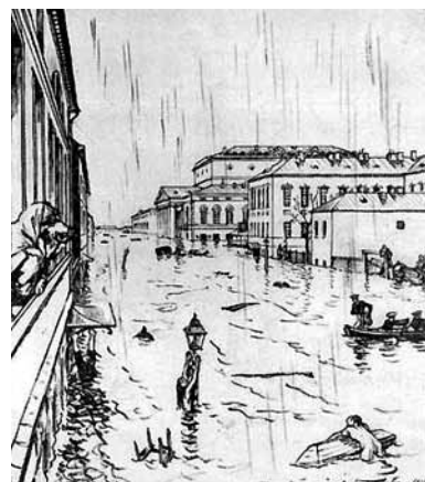
А. Бенуа. Иллюстрация к поэме А.С. Пушкина «Медный всадник»

После основания Петербурга стали во множестве появляться пророчества о скорой гибели города. Главную роль в этих пророчествах всегда играли наводнения — как Божье наказание за отступление от православия, т. е. за новые гражданские порядки, которые ввёл Пётр I. (Первое известное большое наводнение произошло ещё до основания Петербурга — в 1691 г., когда вода покрыла местность более чем на 7,5 м. Такое же наводнение, по словам старых рыбаков, повторялось почти каждые пять лет.)