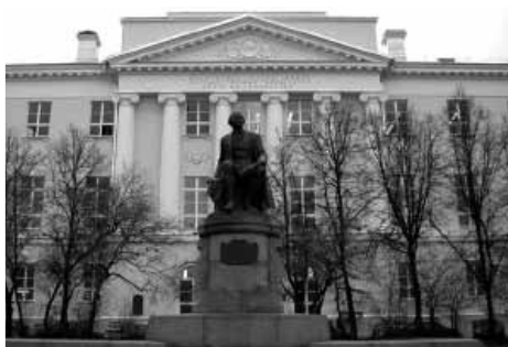
МГУ (старое здание)