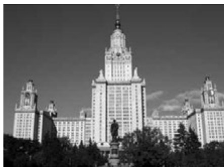
МГУ (новое здание)