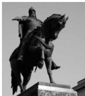
Памятник Юрию Долгорукому