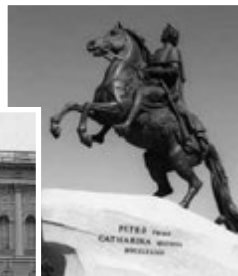
Памятник Петру I