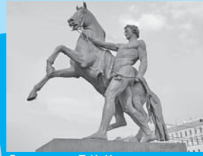
Скульптура П. К. Клодта на Аничковом мосту