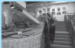
В Музее археологии Москвы